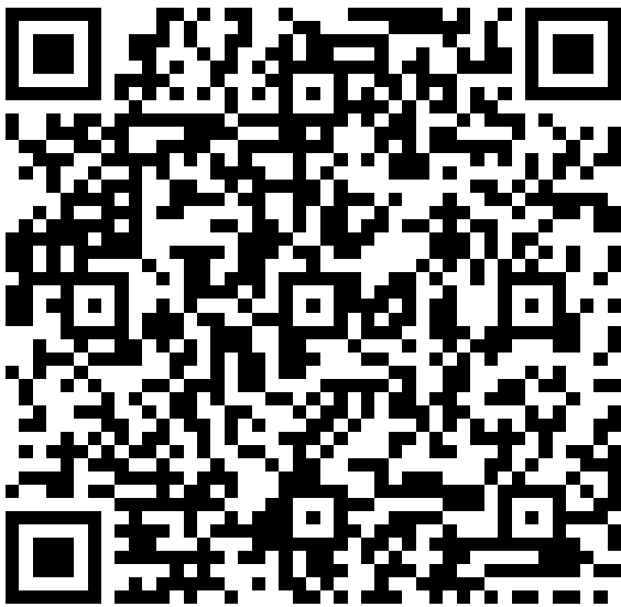
酷課 APP 及親子綁定專區 QR code